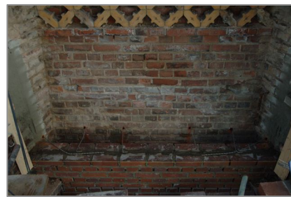
Errichtung der neuen Vorsatzschale