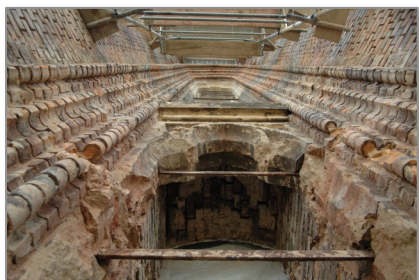
Geöffnete Schallluke

Die Erweiterung der in den 1960er Jahren großenteils geschlossenen Schallluken wurde durch den Glockensachverständigen der Evangelischen Landeskirche, Herrn Andreas Dziewior, dringend angeraten, um negative Auswirkungen der Baumaßnahmen auf den Glockenklang auszugleichen. Aufgrund der damit verbundenen hohen Kosten hatte das Presbyterium sich jedoch gegen eine Schallukenerweiterung ausgesprochen. Durch eine großzügige, zweckgebundene Spendenzusage änderte sich die Lage im Herbst 2010 jedoch plötzlich, so dass nun vier der ursprünglich acht Schallluken auf die Originalhöhe erweitert werden können.