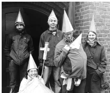
Lebendige Kirchturmspitzen beim KreuzKirchenKarneval.

„Da simmer dabei, ja das is pri-hi-ma, viva, ec-cle-si-a!“ Zwar ist der Karneval nun schon eine gute Passions- und Osterzeit vorbei, dennoch lohnt sich an dieser Stelle ein kleiner Rückblick: Beim ersten Bonner Kreuzkirchen-Karnevals-Zug nahmen die jungen Erwachsenen die dramatische Situation des Kreuzkirchenturms in den Blick und brachten unter dem Motto