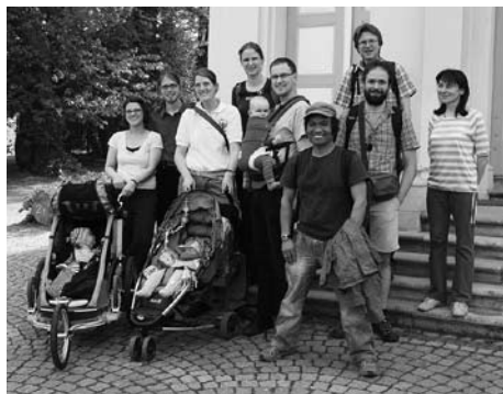
Die Osterwanderer vor der Kreuzbergkapelle.

In inzwischen guter Tradition bietet „mittendrin“ auf Initiative eines Teilnehmers eine ganz besondere Möglichkeit, sich auf das Osterfest einzustimmen: Die „mittendrin“-Osterwanderung. Dazu sammelte sich auch in diesem Jahr am Karsamstag Abend eine kleine Gruppe an der Kreuzbergkapelle, um unterstützt durch einige Andachtselemente, zu Fuß durch das Melbtal über Röttgen die Osternachtsfeier der evangelischen Kirchengemeinde am Kotten-