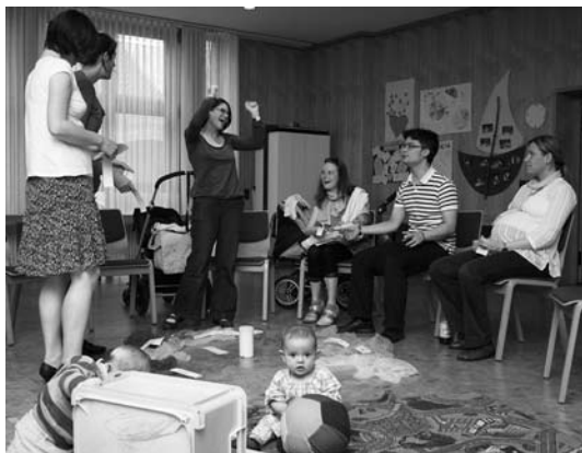
„mittendrin(plus)“: Generationsübergreifender Spaß für Groß und Klein.